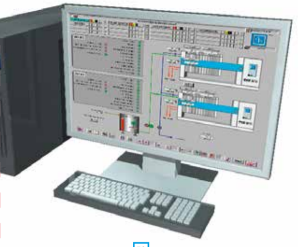
52 Putsch® Integrated Automation PIA PIA Automatisation intégrée Putsch® Automatización integrada Putsch® - PIA